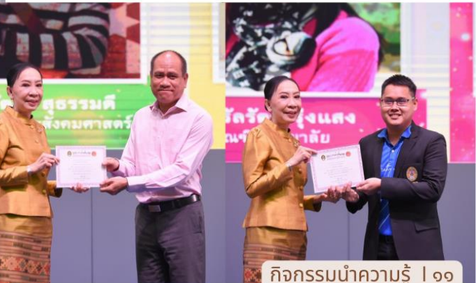
ขอขอบคุณข้อมูลจาก : เครือข่ายประชาสัมพันธ์สำนักประชาสัมพันธ์และสารสนเทศ