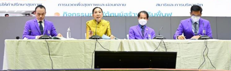
กิจกรรมนำผลิตภัณฑ์สู่ชุมชน