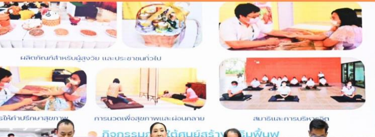
ผลิตภัณฑ์สำหรับผู้สูงอายุ และประชาชนทั่วไป