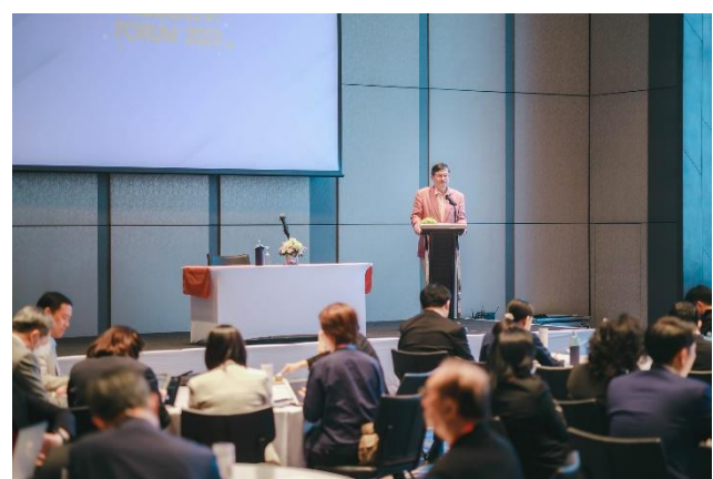
ขอขอบคุณข้อมูลจาก : เครือข่ายประชาสัมพันธ์ สป.อว.

ข้อจำกัดด้านบุคลากรและทรัพยากร รวมถึงการเร่งยกระดับความรู้จากการวิจัยเชิงพื้นที่ให้ขึ้นสู่ระดับทฤษฎีและกระบวนการสร้างความรู้ใหม่ (Theory & Epistemology) การสังเคราะห์ความรู้เพื่อเชื่อมโยงสู่นโยบายและพัฒนาวงวิชาการ ทั้งด้านสังคมศาสตร์ มนุษยศาสตร์ วิทยาศาสตร์ และเทคโนโลยีที่มีผลต่อการพัฒนาพื้นที่ ตลอดจนการสร้างเครือข่ายเพื่อขับเคลื่อนการนำผลงานวิชาการไปขยายผลและการสร้างเครือข่ายวิชาการระหว่างประเทศ