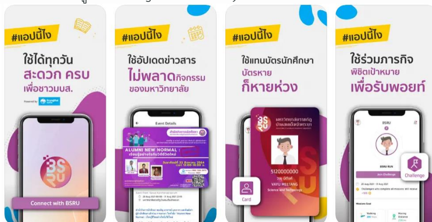
ภาพแอปพลิเคชัน BSRU App