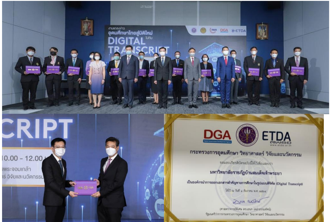
ภาพบรรยายกาศการการรับเกียรติบัตรรับรองการเป็นองค์กรนำการออกเอกสารสำคัญทางการศึกษาในรูปแบบดิจิทัล (Digital Transcript)

ที่ต้อบโจทย์ทุก Lifestyle ในรั่วมหาวิทยาลัย สำหรับนักศึกษา อาจารย์ เจ้าหน้าที่ รวมถึงศิษย์เก่า ที่สามารถรับข่าวสารและกิจกรรมที่สำคัญของมหาวิทยาลัย