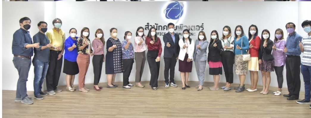
ภาพบรรยายภาคการอบรมและสอบวัดทักษะดิจิทัลด้วยชุดสอบมาตรฐานสากล (ICDL) ของนักศึกษาและคณาจารย์ของมหาวิทยาลัยฯ

2.2) การทำระบบ Digital Transcript ซึ่งเป็นนโยบายของที่ประชุมอธิการบดีแห่งประเทศไทย (ทปอ.) ที่นำมาใช้จัดทำเอกสารสำคัญทางการศึกษาในรูปแบบดิจิทัล การที่ธนาคารกรุงไทย ร่วมกับมหาวิทยาลัยราชภัฏบ้านสมเด็จเจ้าพระยาพัฒนาใช้ BSRU APP ให้เป็น One Stop Service