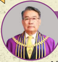
ศ.เกียรติคุณ ดร.ชาติชาย ณ เชียงใหม่ นายกสภามหาวิทยาลัย